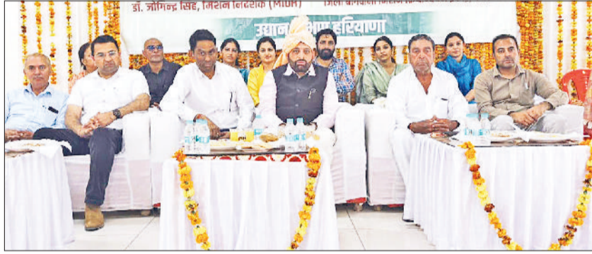
भूना। जिला स्तरीय बागवानी सम्मेलन में मौजूद अधिकारी।