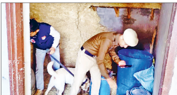
फतेहाबाद। जाखल क्षेत्र में तलाशी अभियान चलाते पुलिस टीम।