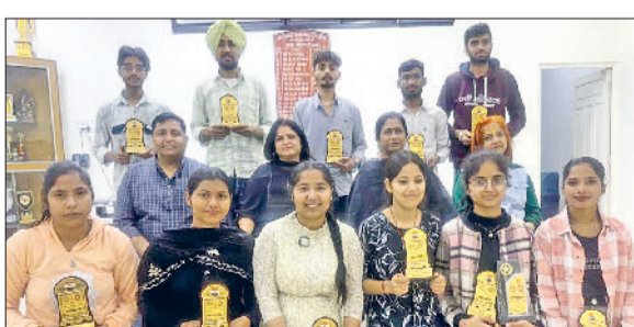
फतेहाबाद। कैम्प से लौटे एनएसएस स्वयंसेवकों को बधाई देते प्राचार्य व अन्य