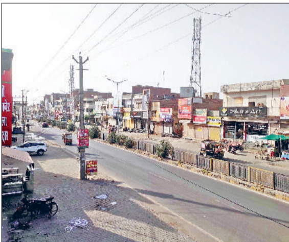
फतेहाबाद। बढ़ती गर्मी के चलते सुनसान पड़ा शहर का हाइवे।

गर्मी ने फरवरी के अंत से ही तेवर दिखाते शुरू कर दिए थे। रात के तापमान में ज्यादा गिरावट नहीं होने से दिन में गर्मी का असर अधिक महसूस किया जा रहा है। यह स्थिति फसलों की बढ़वार को भी प्रभावित कर सकती है। मौसम वैज्ञानिकों के अनुसार 4 मार्च तक एक के बाद एक दो पश्चिमी विशोभ आएंगे। इसके कारण मौसम परिवर्तनशील बना रहेगा। बता दें कि फतेहाबाद में अधिकतम तापमान 31 डिग्री से ऊपर पहुंच गया है, जो समय से पहले गर्मी बढने का संकेत है। दिन के साथ-साथ रात का तापमान भी 15 से 16 डिग्री सेल्सियस बना हुआ है। इसी बीच एक कमजोर पश्चिमी विशोभ