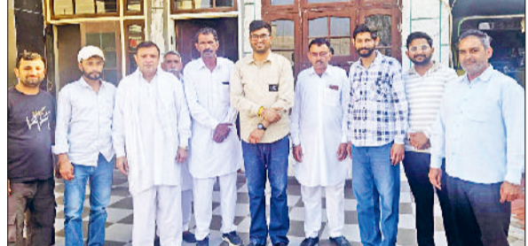
फतेहाबाद। बैठक में मौजूद जजपा नेता।

जननायक जनता पार्टी के राष्ट्रीय अध्यक्ष डॉ. अजय सिंह चौटाला के जन्मदिवस के उपलक्ष्य में 13 मार्च को हांसी में आयोजित होने वाले 'जनचेतना दिवस' समारोह को सफल बनाने के लिए पार्टी ने तैयारियां तेज कर दी हैं। इसी कड़ी में सोमवार 2 मार्च को जेजेपी प्रदेश अध्यक्ष दिग्विजय सिंह चौटाला फतेहाबाद का दौरा करेंगे। जेजेपी के युवा जिलाध्यक्ष जितन खिलेरी ने यह जानकारी देते हुए बताया कि दिग्विजय चौटाला कल दोपहर एक बजे स्थानीय जाट धर्मशाला स्थित 7 स्प्राइस होटल पहुंचेंगे। यहां वे जिले भर के पदाधिकारियों और कार्यकर्ताओं की एक महत्वपूर्ण मीटिंग लेंगे। इस बैठक का मुख्य उद्देश्य 13 मार्च को रैली के लिए कार्यकर्ताओं की ड्यूटियां लगाना