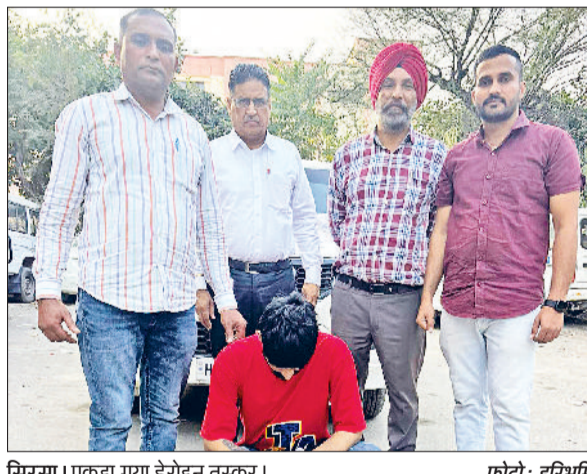
सिरसा। पकड़ा गया हेरोइन तस्कर।

लगा। पुलिस ने शक के आधार पर उसे दबाच लिया और तलाशी ली तो उसके कब्जे में मात्र 27 ग्राम हेरोइन बरामद हुई। आरोपी के खिलाफ शहर थाना में मामला दर्ज किया गया है।